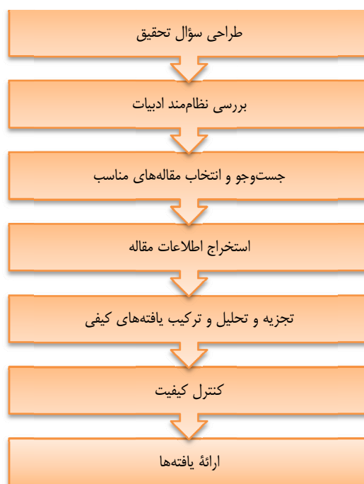
شکل ۱. گام‌های روش فراترکیب

تفسیر داده‌های اصلی مطالعات منتخب است. در روش فراترکیب شش گام اصلی وجود دارد که عبارت‌اند از: تنظیم سؤال تحقیق، بررسی نظام‌مند ادبیات، جست‌وجو و انتخاب مقالات مناسب، استخراج اطلاعات از مقالات، تجزیه و تحلیل یافته‌های کیفی، کنترل کیفیت و ارائه یافته‌ها. در ادامه این بخش، هرگام به‌صورت جداگانه تشریح شده و کاربرد آن در موضوع تحقیق حاضر که بررسی و گروه‌بندی عوامل مؤثر بر موفقیت بازاریابی و بررسی است، بیان می‌شود. شکل ۱ گام-های فراترکیب را به نمایش گذاشته است.