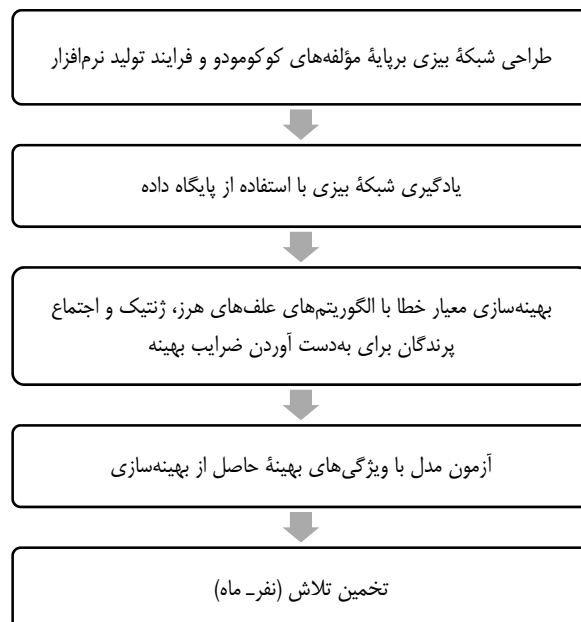
شکل ۱. مدل پیشنهادی برای تخمین تلاش مورد نیاز برای تولید نرم‌افزار