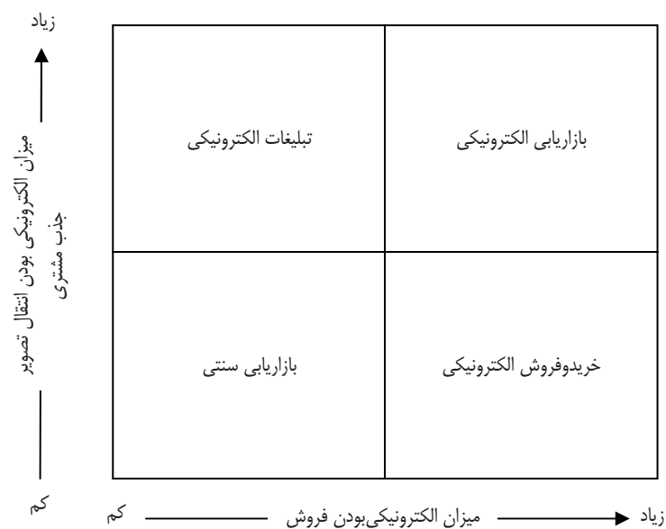
شکل ۱. حیطه بازاریابی الکترونیکی

به منظور دستیابی به تعریفی مناسب از بازاریابی الکترونیکی، همانند شکل ۱ می‌توان از دو بُعد ۱. انتقال تصویر با نام و ۲. انتقال محصول یا فروش به فرایند بازاریابی توجه کرد. چنانچه تصویر به روش الکترونیکی انتقال یابد، تبلیغات الکترونیکی است و اگر فرایند فروش به روش الکترونیکی انجام گیرد، بازاریابی الکترونیکی خواهد بود. بنابراین بازاریابی الکترونیکی عبارت است از «فرایند تبلیغات الکترونیکی و فروش الکترونیکی».