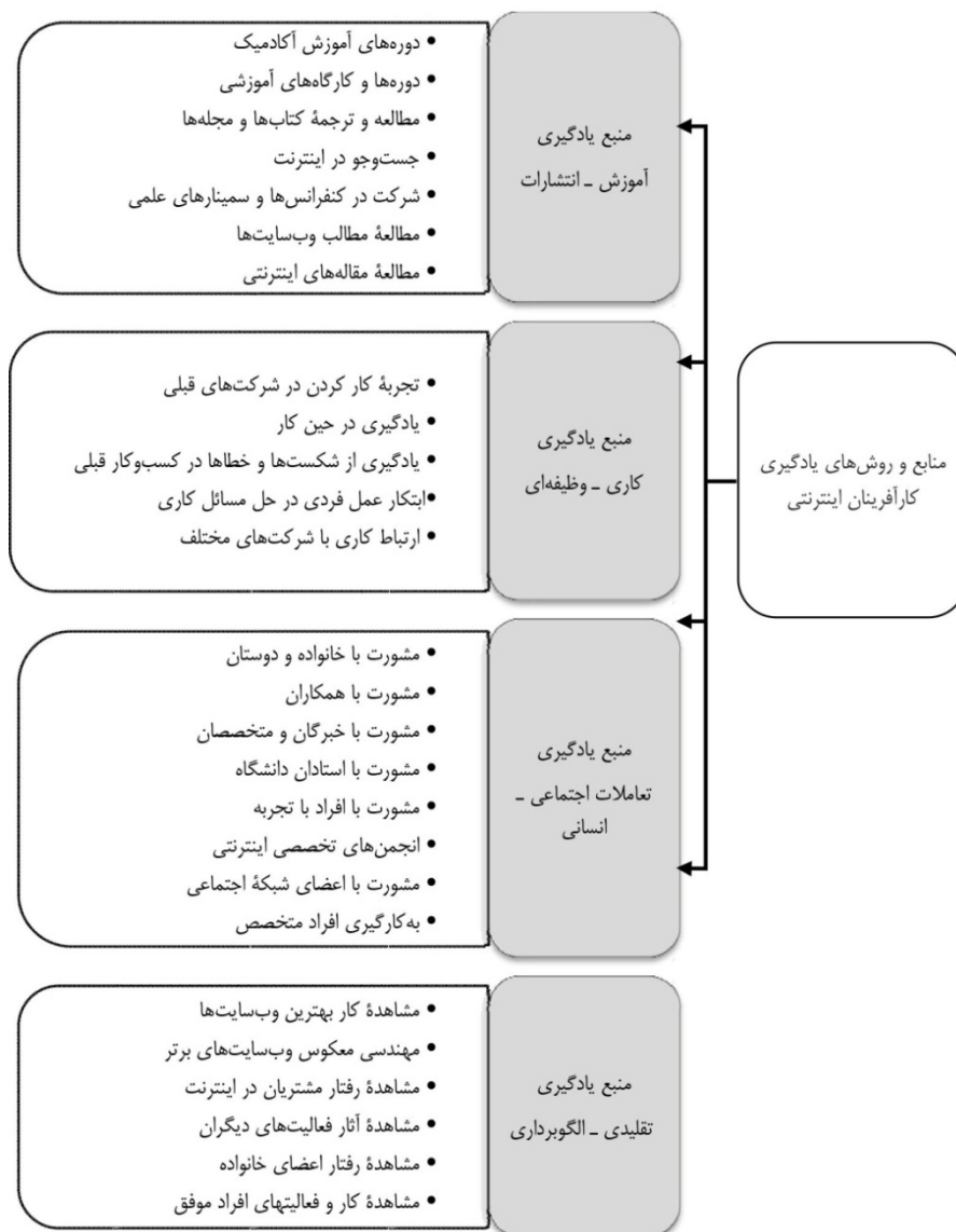
شکل ۲. چارچوب منابع و روش‌های یادگیری کارآفرینان اینترنتی

در این مرحله موارد مشابه در مفاهیم اولیه شناسایی و دسته‌بندی شدند و موارد تکراری حذف گردیدند. مقوله‌های به‌دست‌آمده به تفکیک سه شیوه اصلی یادگیری در شکل ۲ نمایش داده شده است.