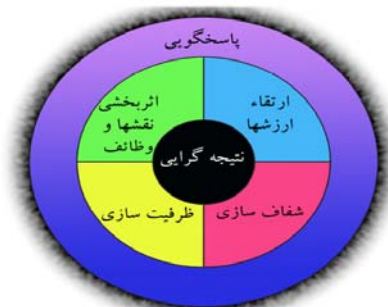
نمودار ۱. شاخص‌ها و استانداردهای حکمرانی خوب در سازمان‌های دولتی و خدماتی [۱۷]

امتیاز مالیه و حسابداری دولتی و سازمان مدیریت دولتی در لندن در سال ۲۰۰۴، اصول و شاخص‌ها و استانداردهای حکمرانی خوب را در سازمان‌های دولتی و خدماتی، طی بیانیه-ای منتشر کردند که پژوهشگران جهت سنجش حکمرانی خوب در سازمان‌ها از مؤلفه‌های زیر استفاده نموده است، که به‌طور اجمالی در نمودار (۱) مشاهده می‌شود.