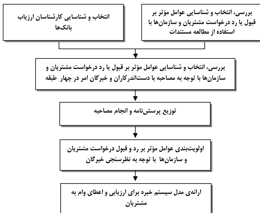
شکل ۲. مراحل انجام پژوهش

این پژوهش از نظر هدف کاربردی و از نظر روش، تحلیلی - پیمایشی است. این پژوهش در دو مرحله انجام گرفته است. در مرحله‌ی اول با مطالعه‌ی مستندات و پژوهش‌های پیشین و مصاحبه‌های اکتشافی با خبرگان دست‌اندرکاران و کارشناسان ارزیابی، درخواست وام‌ها به شاخص‌های کمی و کیفی دسته‌بندی شدند (شکل شماره ۱).