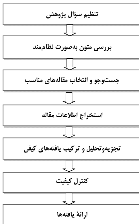
شکل ۲. گام‌های فراترکیب

برای تحقق هدف مورد نظر در این پژوهش، از روش هفت‌مرحله‌ای سندلوسکی و باروسو (۲۰۰۳، ۲۰۰۷) استفاده شده است که شکل (۲) خلاصه این مراحل را نمایش می‌دهد.